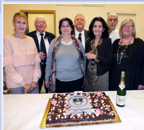
Les membres du Conseil d'administration